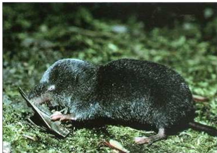
Figura 3. Musaraña rabicorta de Norteamérica ( Blarina brevicauda ) comiendo un insecto.

Tanto Blarina como Neomys suelen atacar a las presas más grandes desde atrás, infligiendo mordeduras en el cuello, desde donde la neurotoxina llega con mayor facilidad al sistema nervioso central (CHURCHFIELD, 1990). Los extractos de esta toxina afectan a los sistemas nervioso, respiratorio y vascular, causando convulsiones, movimiento descoordinado, parálisis y eventualmente la muerte en pequeños vertebrados como ratones y sapos (DUFTON, 1992). Ni Blarina ni Neomys tienen incisivos inferiores