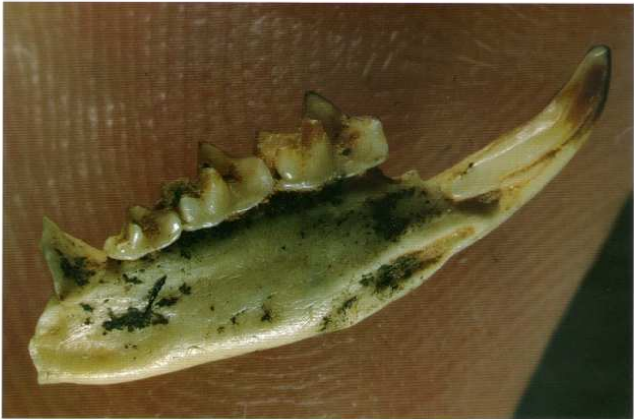
Figura 4. Mandíbula de un espécimen del soricino indeterminado procedente de los niveles correspondientes al Pleistoceno Inferior de la Gran Dolina (sierra de Atapuerca, Burgos, España).

con surcos del tipo descrito en los solenodones, pero los dientes correspondientes presentan superficies internas cóncavas que tendrían la misma finalidad (CHURCHFIELD, 1990).