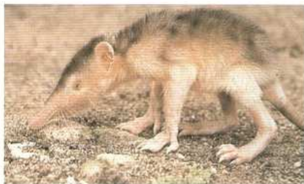
Figura 1. Solenodon de Haití ( Solenodon paradoxus ).

Los solenodones o almiquís eran los carnívoros dominantes en las islas de Cuba y Haití antes de la llegada de los españoles. Son parecidos, hasta cierto punto, a musarañas muy desarrolladas de patas largas (fig. 1). De hecho, junto con los erizos, son los insectívoros de Laurasia más grandes que existen. El solenodon de Haití segrega saliva tóxica y probablemente