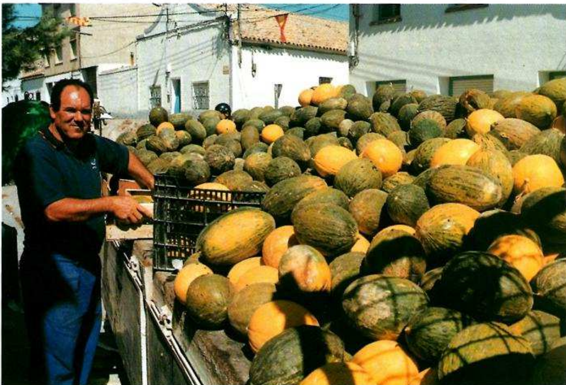
En la agricultura ecológica el agricultor debe ser noble y bonrado, si no es así difícilmente podrá hacer esta agricultura.

Actualmente tenemos en Aragón 5.600 Has. con su correspondiente variedad de productos: cereales, frutas, aceites, carnes, conservas, plantas aromáticas, vinos... de una gran calidad. Calidad que se está imponiendo y se exige en Europa y es el futuro de nuestra agricultura. ●