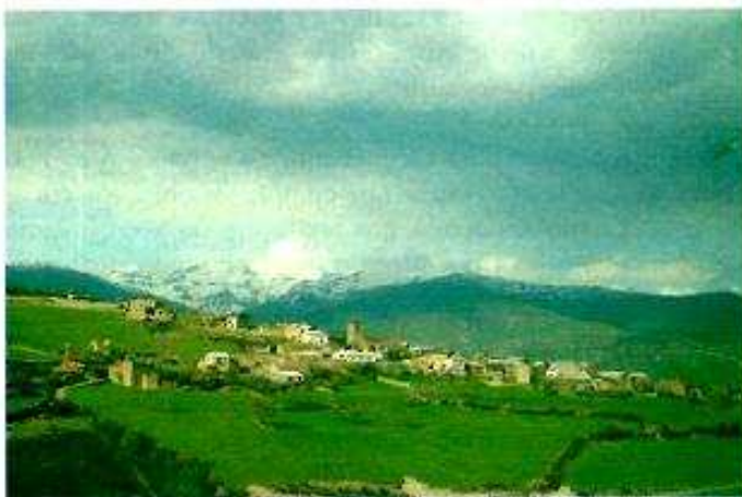
Foto nº 1: Los procesos de Interpretación crean un vínculo afectivo entre el hombre y la naturaleza. En la foto SINUES, Valle de AISA

Si tenemos en cuenta que la interpretación del entorno empieza cuando la persona se interesa por el mismo y comienza a percatarse de sus componentes y de las relaciones que se manifiestan, se hace necesario apoyar todas las iniciativas que en este campo se den tanto en los distintos medios ( rural o urbano), asociaciones, entidades, etc. como en sus enfoques ( culturales, geológicos, históricos, botánicos, de observación,...) puesto que la E-A parte de un concepto de Medio Am-