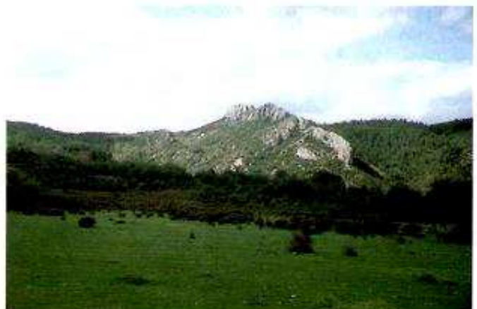
Foto nº 3: Los Itinerarios son un elemento fundamental dentro de las Técnicas aplicadas en la Educación Ambiental. Vista de San Andrés. SINUES.

En estas fases es muy importante tener en cuenta el papel de los indicadores ( componentes del entorno cuya presencia