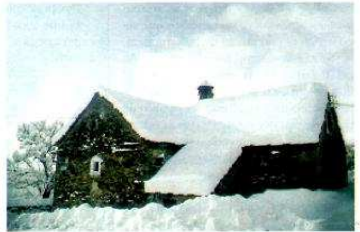
Foto nº 2: En los procesos de Interpretación es fundamental analizar el papel del hombre en la transformación y conservación del paisaje. SINUES Valle de Aisa

recto con ellos y apoyada el uso de mediadores (carteles, gráficos, medios audiovisuales,...) no limitándose a una mera información de los hechos sino a una búsqueda de una relación afectiva entre el sujeto y el medio.