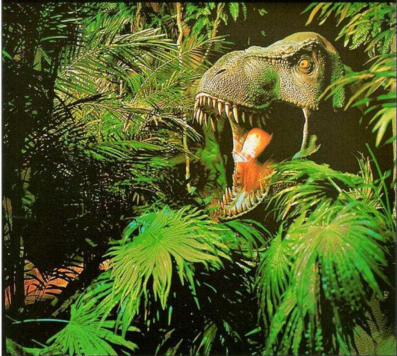
Cabeza de Tyrannosaurus rex , escena del Raid.