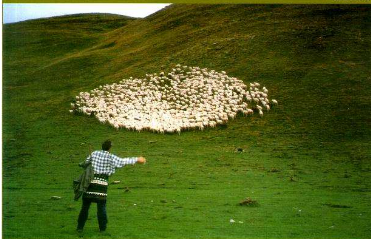
Pastor guiando rebaño de ovejas.