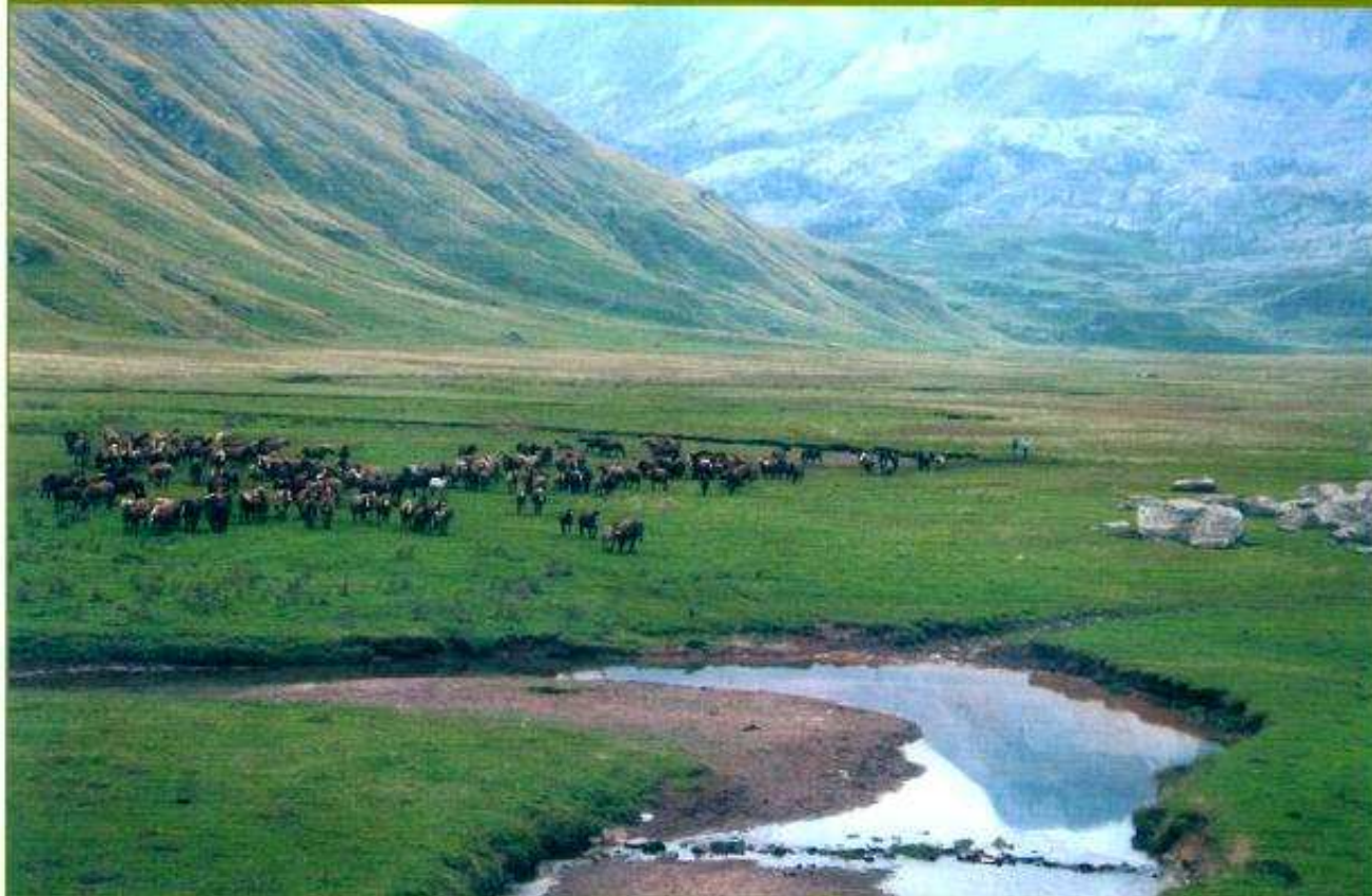
Caballos en Aguas Tuertas.

La experiencia de elaboración del PORN de los Valles ha procurado consolidar espacios de participación vecinales en los que se tomen decisiones entre todos los agentes implicados y que éstas se incorporen a las propuestas de planificación y gestión de su territorio.