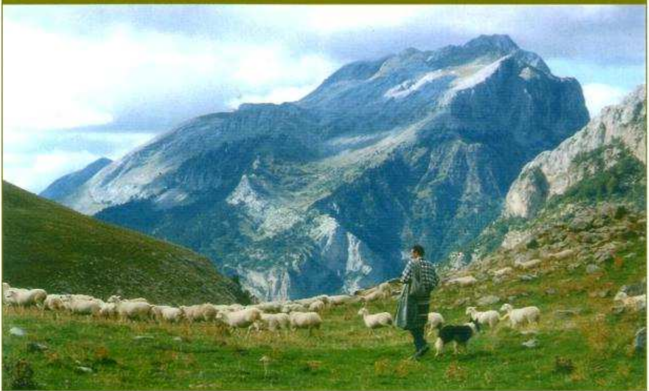
Pastoreo en el entorno de Peñaforca...

blemas que afectan al sector ganadero y sus relaciones causales.