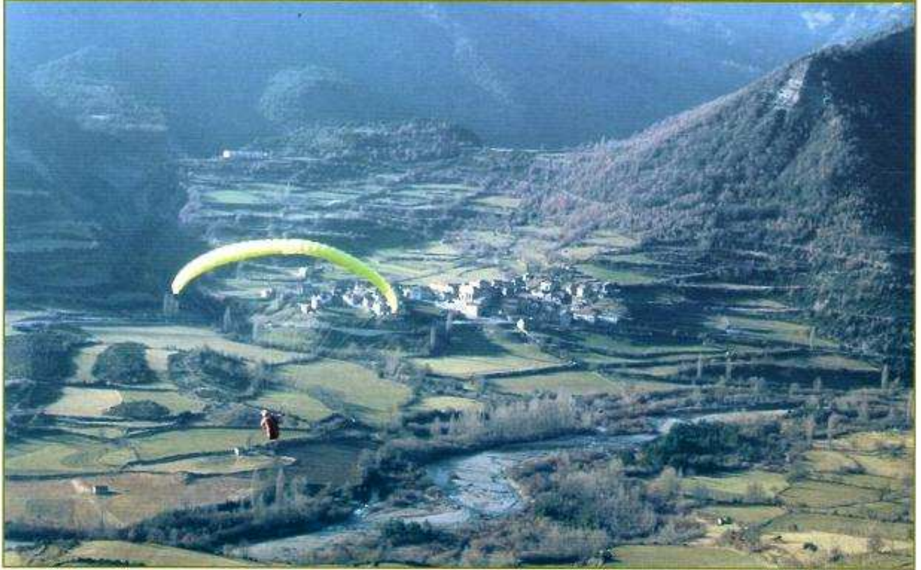
Vuelo con parapente.

Aragón, y así fue reconocido legalmente su derecho a participar en el proceso. El objetivo era dar la vuelta a una situación conflictiva en su nacimiento.