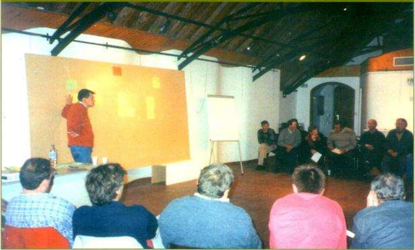
Taller de participación de ganaderos.

objetivos: Plan de acción con una previsión a tres años de una inversión de 3.000 MPTS.