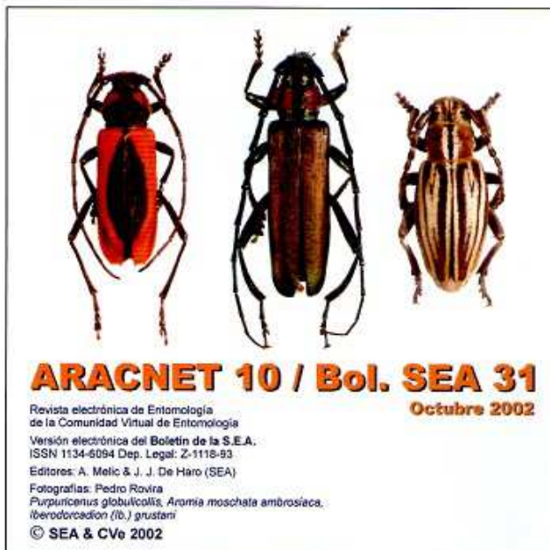
Figura 1. Portada de la revista electrónica de entomología ARACNET.

Monografías SEA. Trabajos monográficos, catálogos nacionales, etc. Diez volúmenes pu-