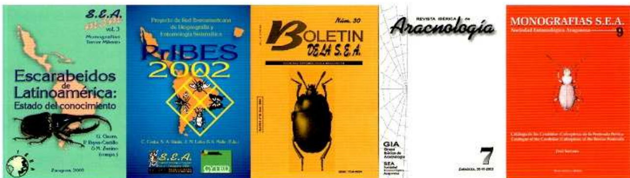
Figura 3. La SEA es una de las asociaciones entomológicas más activas en materia editorial de todo el mundo.

La SEA, junto a su vida estrictamente científica, viene llevando a cabo otro tipo de actividades relacionadas con la divulgación de este tipo de estudios (de sus resultados más notables) entre el público en general. Consideramos de vital importancia la difusión de los avances en biología en la sociedad no especializada. En este sentido ha preparado en el pasado dos exposiciones itinerantes sobre los Insectos que han sido patrocinadas por Ibercaja (la segunda de ellas se encuentra en activo). Las exposiciones