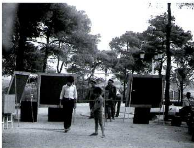
Figura 2. III Exposición en el parque del castillo Palomar (Zaragoza).

Una de las campañas más largas (1982-1990) y de las que nuestra asociación llevó el peso de organizar fue salvar de la roturación algunas zonas naturales de La Alfranca y conseguir que, por fin, se tomasen medidas para acabar con la alteración que venía sufriendo. En 1990 inauguramos en La Alfranca el primer Centro de Interpretación de Aragón, reacondicionando una antigua nave de cría de cerdos.