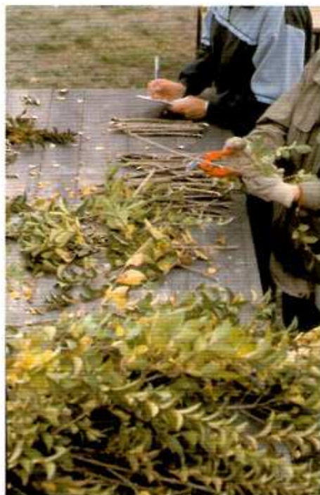
Figura 4. Estaquillando en el Vivero.

La gran riqueza de nuestro patrimonio natural ha hecho que su defensa sea uno de los planteamientos fundamentales de la Asociación