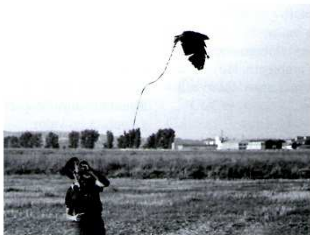
Figura 3. Recuperando a un busardo ratonero.

inicial e iniciar una nueva fase favorecida por el reconocimiento de la UNESCO que lo incluyó en 1990 dentro de los proyectos «Hombre» y «Biosfera MaB». Actualmente, por encargo del Ayuntamiento de Zaragoza, se atiende el centro del galacho y se gestiona un grupo de voluntarios.