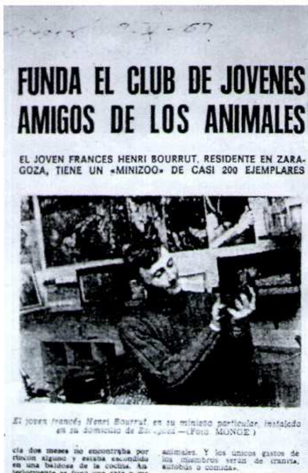
Figura 1. Artículo en el diario Amanecer.