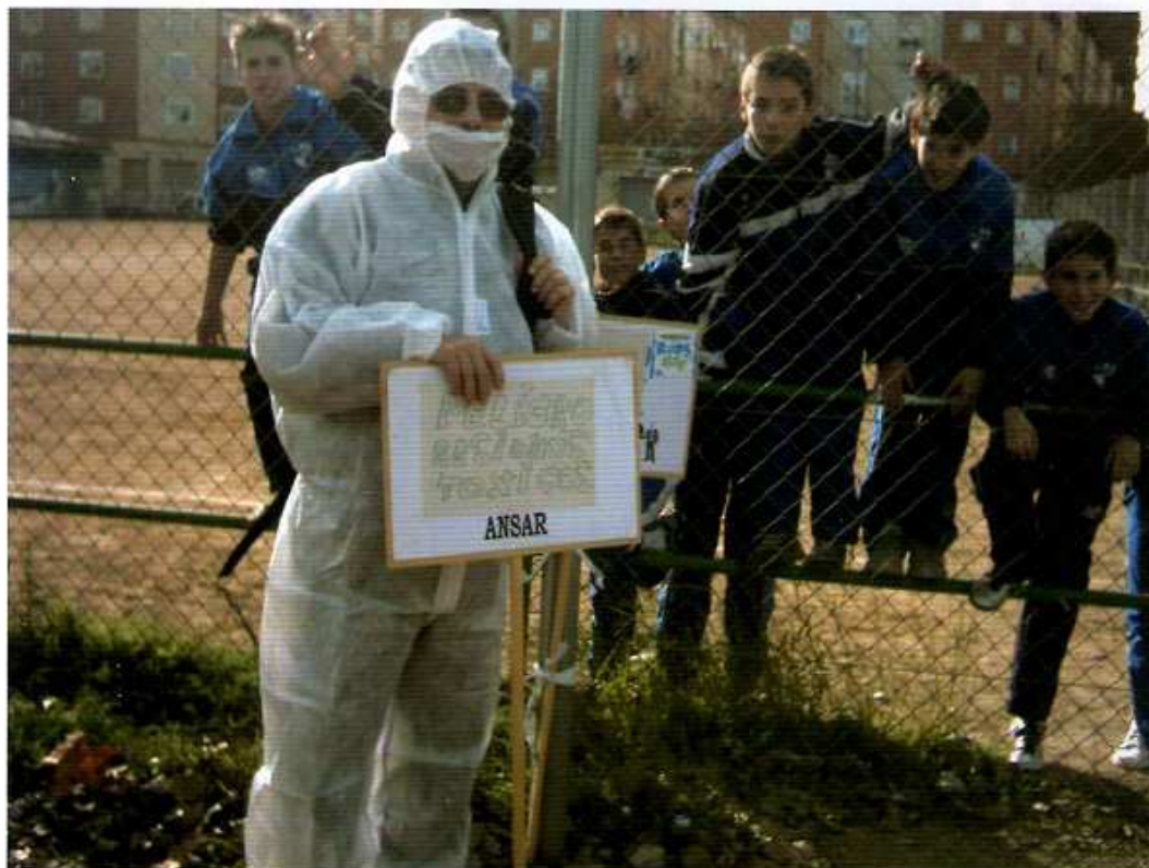
Figura 7. Supermariano: reivindicando la limpieza de antiguos residuos en La Almozara (Zaragoza).

• El Consejo de Protección de la Naturaleza de Aragón (CPN) fue el resultado de una decidida apuesta de la asociación por crear en Aragón un órgano de participación ciudadana en materia de medio ambiente. El esfuerzo cristalizó con la aprobación de la Ley 2/1992 por la que se creaba el CPN, donde están representados empresarios, sindicatos, instituciones de investigación, la administración y organizaciones ecologistas.