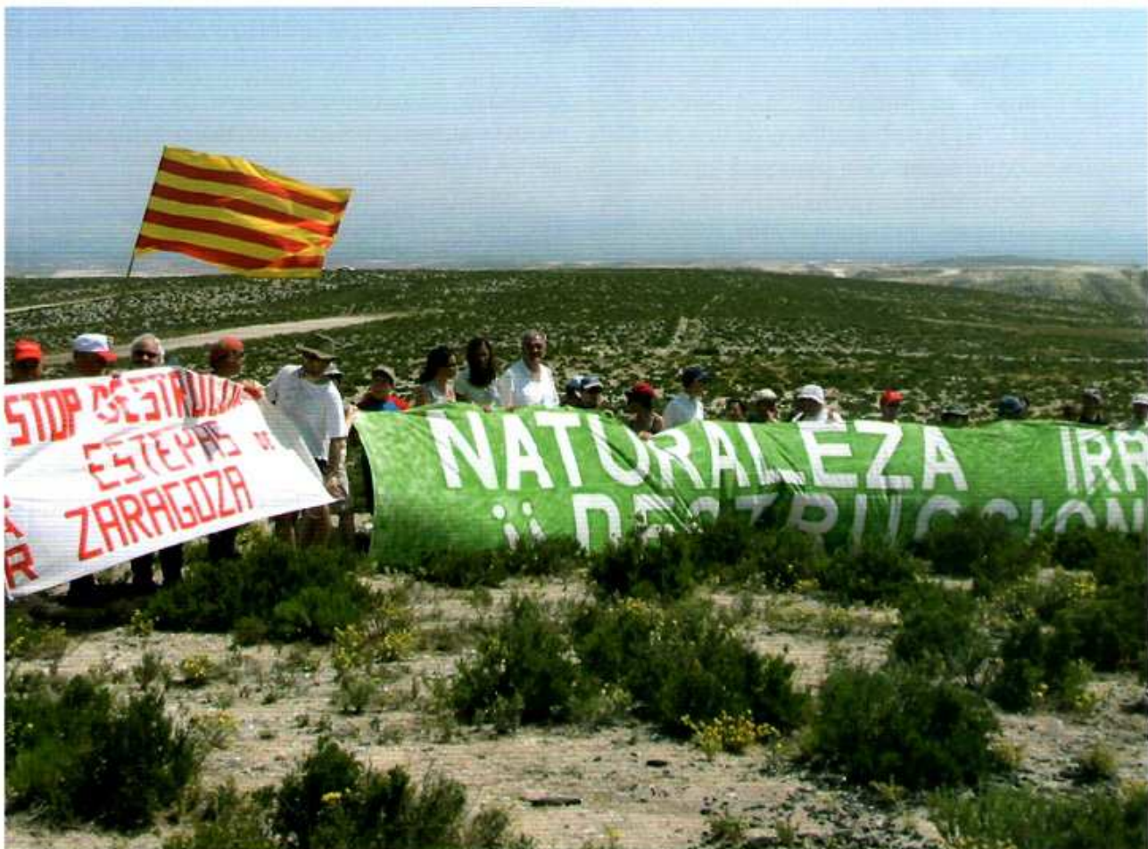
Figura 6. Reinvidicando la estepa con un abrazo estepario.

• La defensa de la estepa, con sus vales, planas, montes y cabañeras, contra el avance des-