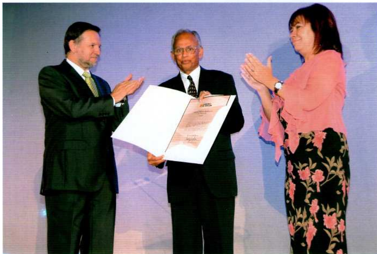
Figura 3. El presidente Marcelino Iglesias, el profesor Asit K. Biswas y la ministra Cristina Narbona.

propios en los equipamientos y acciones dirigidas a la prevención y defensa de incendios forestales, así como su importante labor en la implantación de puntos limpios y la recogida selectiva de envases en las localidades de la comarca». En cuanto al consistorio, el premio galardona «su iniciativa en el proyecto de instalación de una astacifactoría para la cría de cangrejo autóctono en una balsa ubicada en su término municipal», instalación de gran importancia para el recién aprobado Plan de Recuperación del Cangrejo común.