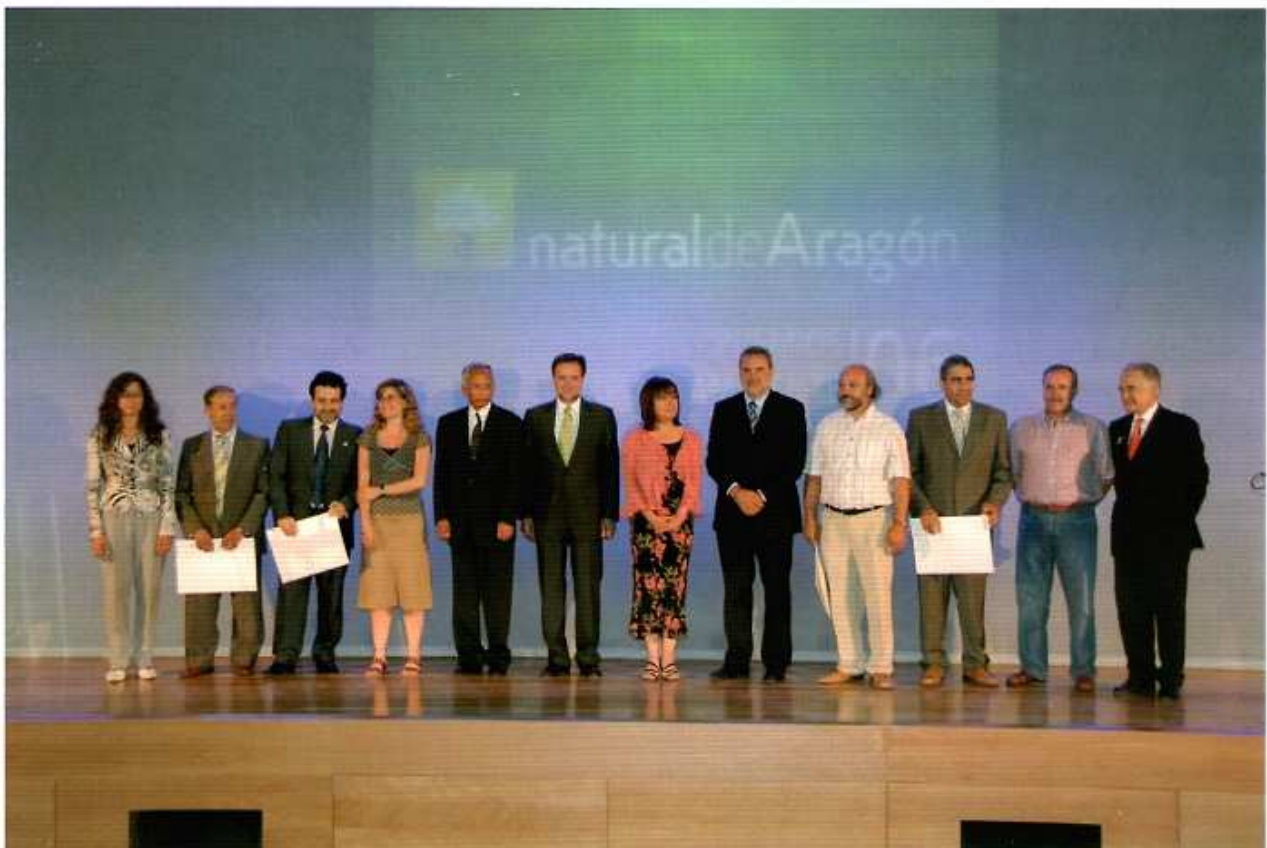
Figura 1. Entrega de los Premios Medio Ambiente de Aragón 2006, el 5 de junio de 2006.

premio ha sido concedido al profesor Asit K. Biswas. Además de esta máxima distinción, han sido reconocidos, en diversas categorías, Hoteles Palafox, el Centro Politécnico Superior de la Universidad de Zaragoza, la Comarca del Matarranya/Matarraña, el Ayuntamiento de Cañizar del Olivar y el Colegio de Educación Infantil y Primaria «Miguel Servet» de Villanueva de Sijena (Huesca). Todos ellos han recibido el reconocimiento público de estos premios destinados a impulsar la conciencia ambiental de los ciudadanos y a fomentar las